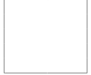
DENİZ POLAT GÜVENLİK SORUMLUSU